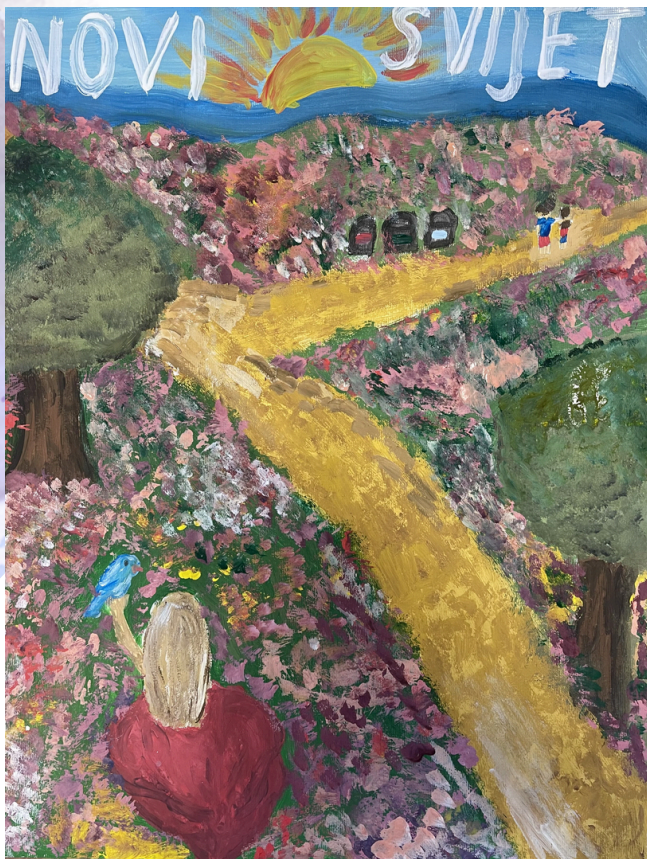
6. Lejla Papić OŠ Čazma