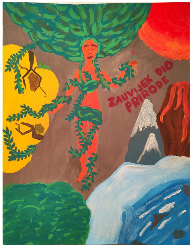
7. Erin Tomšić III. OŠ Bjelovar